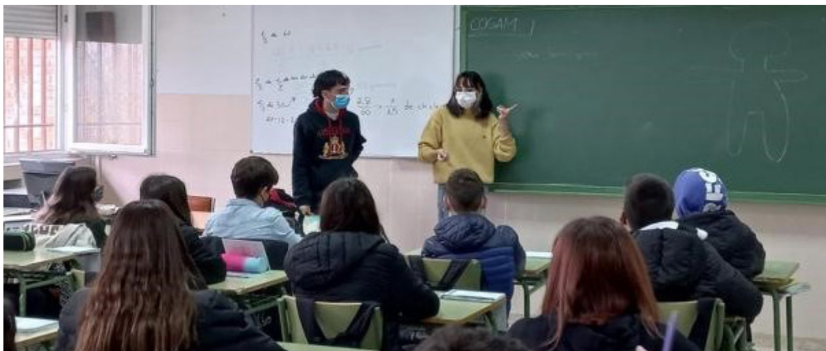
Nota. Fotografía cedida por COGAM.

Concretamente, los talleres impartidos constan de una o dos sesiones de una hora cada una de ellas, que generalmente se distribuyen en un periodo de dos semanas. Así, en función de la audiencia a la que se dirige se organizan de la siguiente forma: